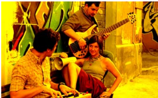
urbanSoul - We Keep GroOvin'. DO YOU?